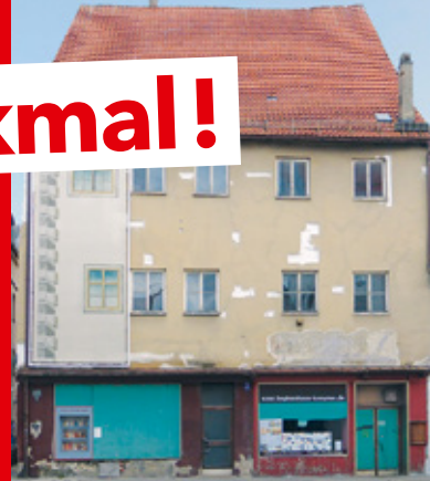
Beginnhaus ↑ Nonnenturm ↓